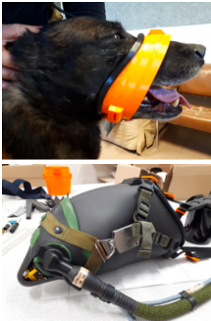
A gauche : malinois parachutiste du CPA-10 équipé du support d'attache de masque à oxygène ; à droite : masque à oxygène pour chien parachutiste du CPA-10