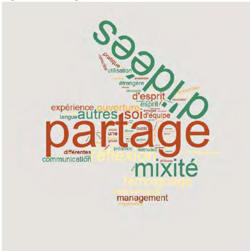
Figure n° 2 – Nuages de mots clés issus des évaluations